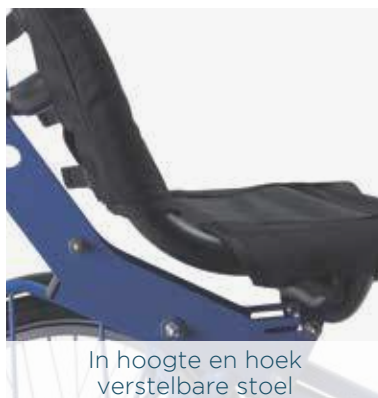
In hoogte en hoek verstelbare stoel